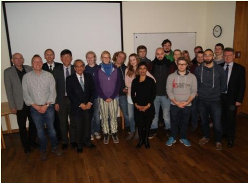
Interessierte Studentinnen und Studenten sowie deren Lehrkräfte des Studiengangs Internationale Forstwirtschaft der Universität Hamburg zusammen mit der malaysischen Delegation.